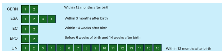
Figure 2 - Paternity/Co-parent leave policies in weeks

The landscape of paternity leave has changed even more rapidly. Many organizations now provide between four and sixteen weeks of leave for the non birthing parent, under widely different names. Importantly, nearly all organizations allow this leave to be taken flexibly within the first months after birth.