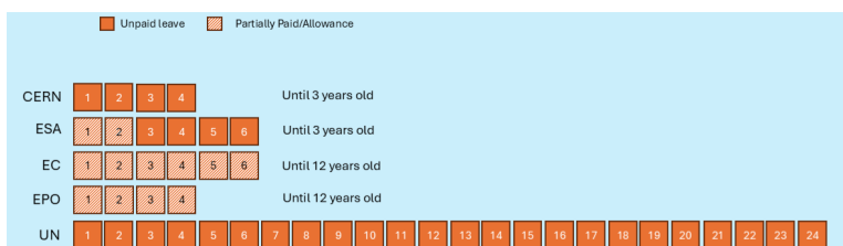
Figure 3 - Parental Leave Policies in months